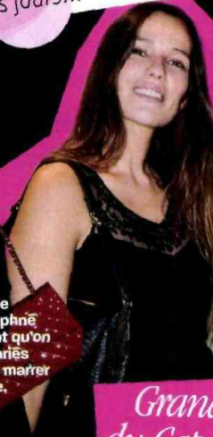
Grand Hôtel du Cap Ferrat