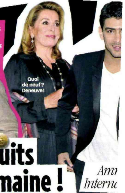
Quoi de neuf? Deneuve!